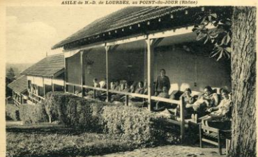
688. Le 1900